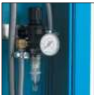
Luftfilter / Wasserabfluss / Druckregler